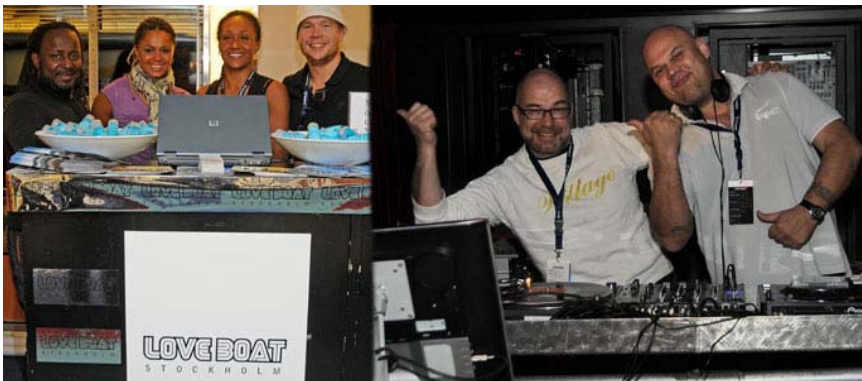
Nikon D300