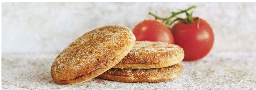
fibröst och gott

Efter en hård arbetshelg med mycket plåtande ombord Tallink Silja Galaxy och Loveboat-kryssningen. var det daga att se verkligheten i vitögat igen måndag morgon.