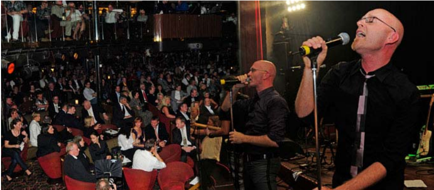
Den fräscha salongen "Starlight Palace" var välfylld med VIP-gäster fr'n Eallink Silja-koncernen och Rångedalarna bjöd på fullt ös.

I Under lördagskvällen avgick Tallink Siljas nya nöjesfartyg "Galaxy" på sin officiella invigningskryssning. Ett fullspäckt showprogram väntade de utvalda VIP-gästerna när de kom ombord. Från avgångstiden ända fram till klockan 06 på morgonen, fanns inga döda punkter för den som hade ork.