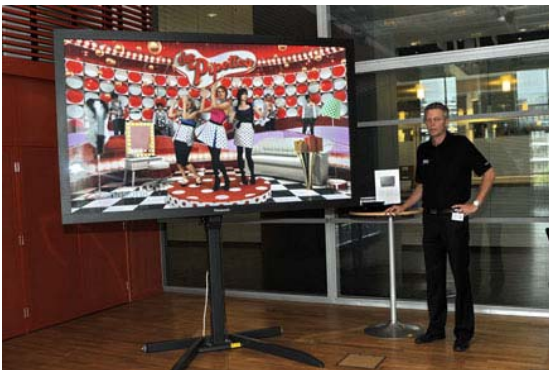
Något för din lilla 1:a på 35 kvadrat...?

Är du inte nöjd med din nuvarande platt-TV? Känns den för liten?